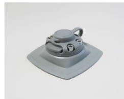
品番 : BK-FMS224G 品名 : ベース&マウント 粘着シート付 カラーグレー