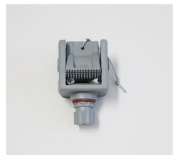
品番 : BK-AL002G 品名 : アンカーロック カラーグレー