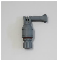
品番 : BK-NG003G 品名 : GO PRO用マウント カラーグレー