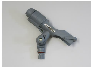
品番 : BK-HT213G 品名 : ロッドホルダー カラーグレー