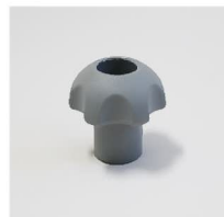
品番 : BK-KN222G 品名 : ノブナット ロング カラーグレー