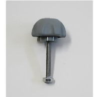
品番 : BK-KN223G 品名 : ノブナット ショートネジ付 カラーグレー