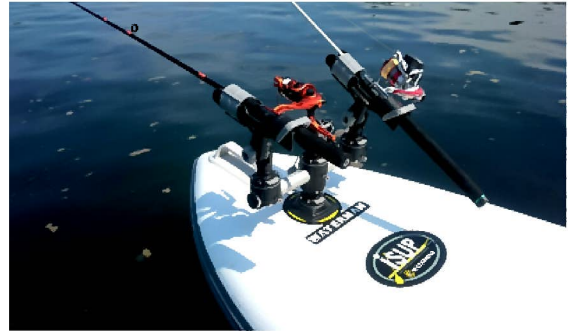
3連マウントに エクステンション付ロッドホルダーと ロッドホルダーを装着したイメージ