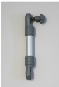
品番 : BK-EX225G 品名 : エクステンション205mm カラーグレー