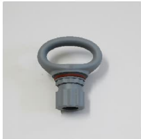
品番 : BK-RM273G 品名 : リングアイ カラーグレー