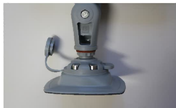
ロッドホルダーの根元にある赤いラインが消えるまで差し込み マウントレバーを横に押ししっかりロックしてください。