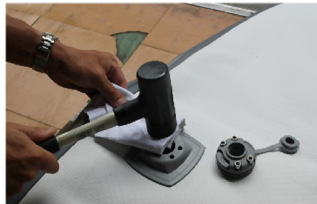
四角ベースの中央部分はビス等で 当て布し保護してゴムハンマーで圧着