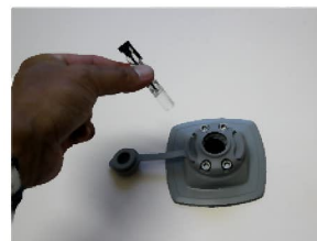
差し込具合が堅い場合はマウント内部に付属の シリコンオイルを差してください。

※輸用品につき輸送中にシリコンオイルが小袋内で漏れる場合がございます。商品受け取り時に容量が少ない際はお申し付けください。またホームセンター等でも販売しております。