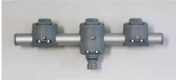
品番 : BK-GM350-3G 品名 : 3連マウント グレー