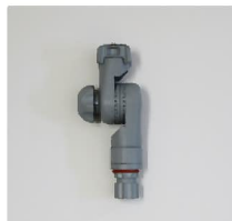
品番 : BK-TP014G 品名 : カメラ用マウント カラーグレー