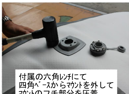
付属の六角レンチにて 四角ベースからマウントを外して マウントのフチ部分を圧着

接着する材料表面の油分、水分、ほこりを除去してください。 使用艇の場合は塩分が付着していますので 適度な温度のお湯で塩分洗浄し脱脂を行ってください。 作業室温が20℃以上であることが望ましいです。 接合部に50N（約5kg）ほどの圧をかけて圧着してください。 ゴムハンマー等で圧着が望ましいです。ハードボードの場合はハンマーの叩きすぎにご注意ください。 インフレーターの場合は空気が抜けた状態で圧着しやすいように取付位置のボードの下に台座等を敷き平らな状態にしてムラなく圧着してください。 レール部分など、R形状部分に接着する場合は入念に圧着をしてください、圧着があまりいと剥がれる原因になります。 インフレータータイプは空気を抜き、折りたたむ際はベース部分に折り目がこないようにたたんでください。