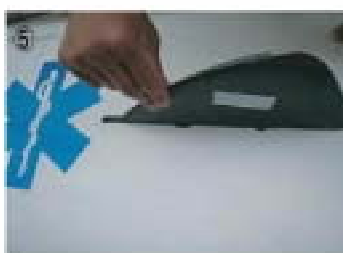
⑤ しっかりと差込ノーズ側へつめる。