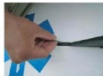
⑥ ①で外しておいたネジをネジ穴に差し込む。この際動いたプレートとネジを合わせる。