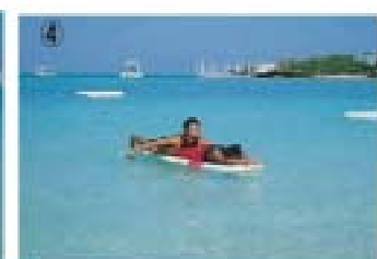
④ 溺者の身体を全てボードに乗せ終えたらボードを浜に向けてパドルして浜に向かう。