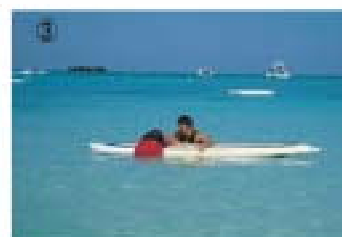
③ 溺者の上半身がボードのデッキに乗ったら同じ様に下半身も乗せる。