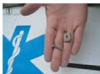
① フィンに付属されているネジとプレートを外す。