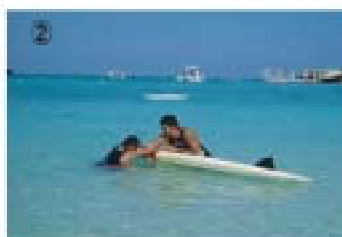
② ボードが反転したら溺者の肘をしっかりとレールにかけ、もう一度反転させる。