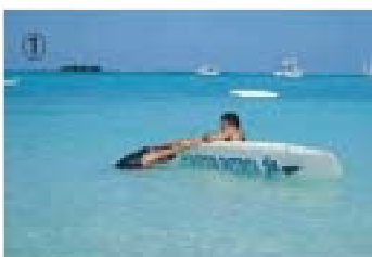
① 溺者の手首をしっかりと掴んだままボードのレール(側面)に手首をかけそのまま反転させる。