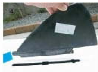
④ フィンの差込方向