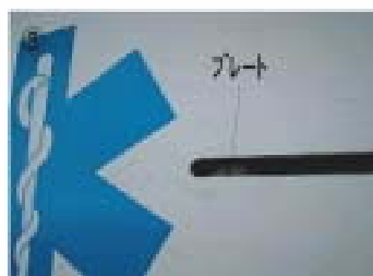
③ 動いたプレートをノーズ側の端へスライドさせる。