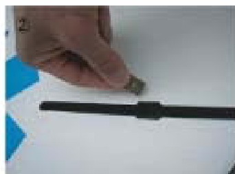
② プレートを中央の穴から入れ中に動かす。