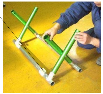
3 ジョイントパイプをスタンドパイプ下側に差し込みます。