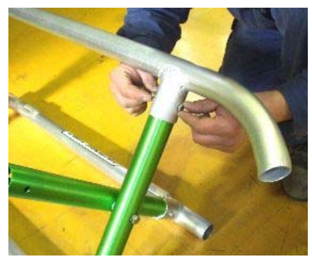
差し込んだ部分の穴にM6ボルト類で仮締めします。全て仮締めしたら全部のボルト類(上下)を増し締めしフレーム組は完成です。ベルト装着は組立写真②を参照ください。

※差し込む向きに注意してください！ イント曲げ部が極端に内側に向く向きではなく、 下方向に垂れて少し内側に向く向きで組立ください。