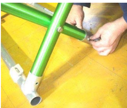
差し込んだ部分の穴にM6ボルト類で仮締めします。