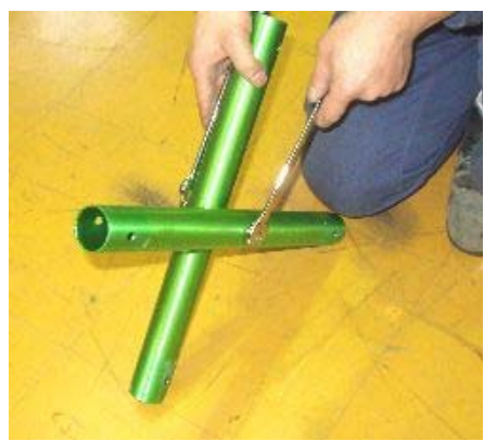
1 インナージョイントパイプをM8ボルト類で組みます。