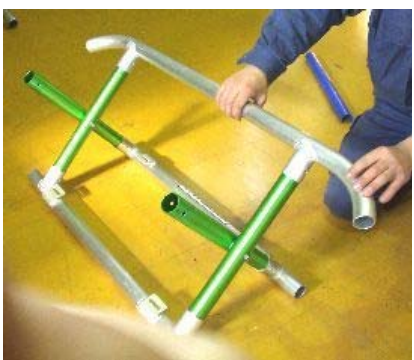
4 スタンドパイプ上側をジョイントパイプに差し込みます。

※差し込む向きに注意してください！ イント曲げ部が極端に内側に向く向きではなく、 下方向に垂れて少し内側に向く向きで組立ください。