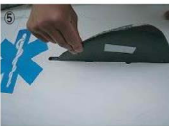
⑤ しっかりと差込ノーズ側へつめる。