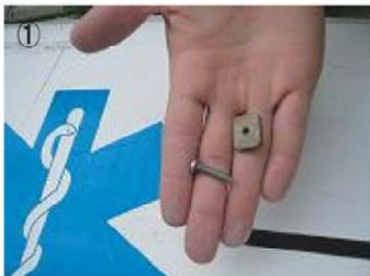
① フィンに付属されているネジとプレートを外す。