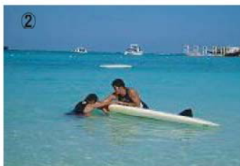
② ボードが反転したら溺者の肘をしっかりとレールにかけ、もう一度反転させる。