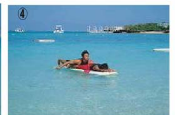
④ 溺者の身体を全てボードに乗せ終わったらボードを浜に向けてパドルして浜に向かう。