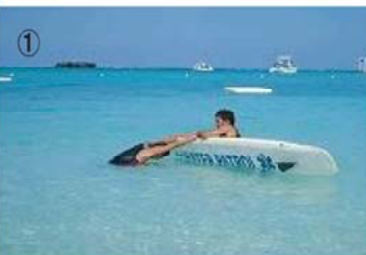
① 溺者の手首をしっかりと掴んだままボードのレール(側面)に手首をかけそのまま反転させる。