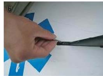
⑥ ①で外しておいたネジをネジ穴に差し込む。この際敷いたプレートとネジを合わせる。