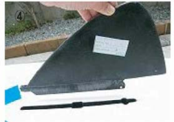
④ フィンの差込方向