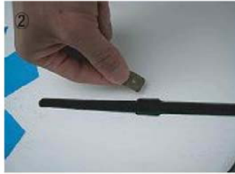
② プレートを中央の穴から入れ中に敷く。