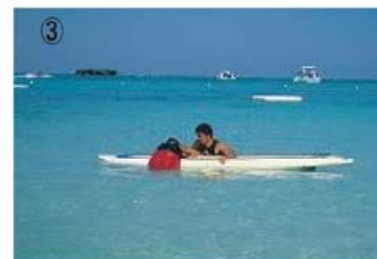
③ 溺者の上半身がボードのデッキに乗ったら同じ様に下半身も乗せる。