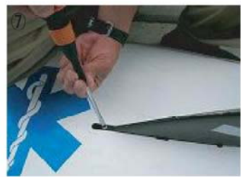
⑦ ドライバーでしっかり締める。