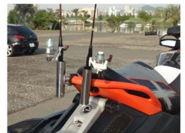
2個装着イメージ写真

出港前に気象を確認。荒天時は出航しない。 網に近づかない。漁船や乗合い船等近づかない。 単独は危険なので複数艇で行く。 釣り糸、ペラ吸い込みに注意。 あまり遠くへ行かない、沿岸でも十分に釣れます。 釣りに夢中になり自分の位置や周囲を見落とさない。 両手がフリーな時が多くバランスを崩して落水しないよう注意。 2人の場合特に不意にアンバランスになりやすいので声をかけ合ひましょう。