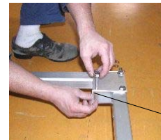
つぶれ止パイプカラー

●3人乗までのPWCまたは和船18ftまで以外は積載しないでください！破損の原因になります。その他使用上の注意をご確認ください。